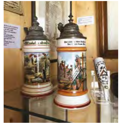
Zunftkrüge und Zunftpfeife

Noch mehr Interessantes über die Maurer aus Rimpfar, insbesondere die zahlreichen verschiedenen Werkzeuge, finden sich im Maurer- und Zimmereimuseum.