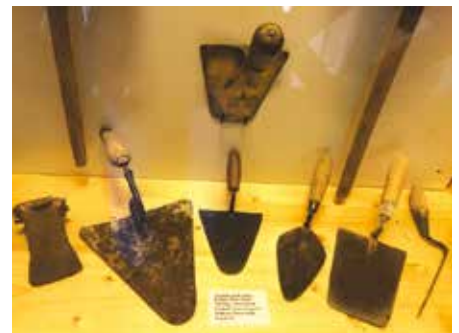
Ein wichtiges Werkzeug des Maurers – die Kelle