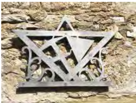
Das Zunftwappen der Maurer über dem Eingang des Maurer- und Zimmereimuseums

Betrifft man das Maurer- und Zimmereimuseum sticht einem gleich die sog. Zunfttruhe der Rimparer Maurer, Steinhauer und Zimmerleute ins Auge, die aus den Jahren um 1700 stammt. In der Zunfttruhe wurden neben wichtigen Dokumenten und Wertobjekten der Zunft, wie Zunftbücher, Statuten und Namensverzeichnisse, Geldvermögen und die Siegelstempel aufbewahrt. Auch Zunftbecher gehörten zum Wertbesitz und sind im Museum zu bewundern. Auf ihnen zu finden der Sinnspruch: „Gottlob, daß ich ein Maurer (Zimmermann) bin, ich denk ich bin's in Ehren und, dass ich froher Sinn bin soll mir kein Teufel wehren.“ Die Truhen wurden aus Holz angefertigt und oft mit dem Zunftwappen versehen. Weitere tolle Ausstellungsstücke sind der älteste Bauplan der Marktgemeinde Rimpar aus dem Jahr 1857, für das Wohnhaus in der Austraße 20/22. Da die Wohnungen für die Forstbeamten im Schloss sehr primitiv waren, suchten diese nach einer Möglichkeit das Forstamt und die Wohnungen in einem Neubau unterzubringen. Der Antrag wurde allerdings von der obersten Forstbehörde abgelehnt. Prüfzeugnisse und Lehrzeugnisse und zahlreiche Werkzeuge der Maurer sorgen für einen Einblick in das damalige Maurer leben. Das dies sicher sehr anstrengend war wird klar, wenn man die sog. Ziegelsteinkraxe sieht. Auf dem Rücken geschnallt und mit Ziegelsteinen beladen hob sich sicher so mancher Maurer einen Bruch.