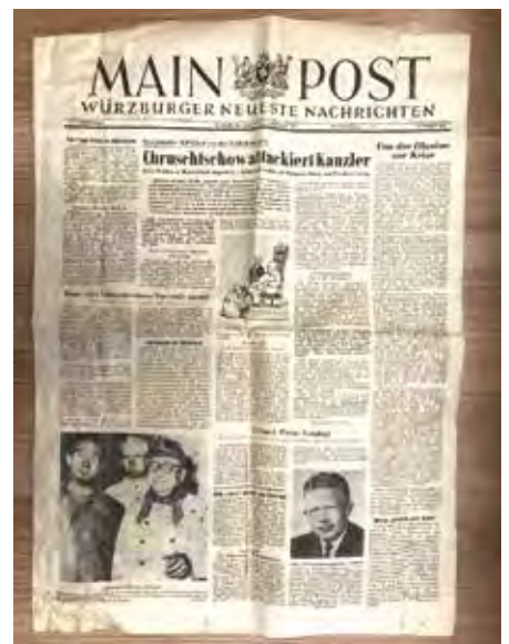
Die ebenfalls in einer Bierflasche deponierte Mainpost vom 9. August 1957