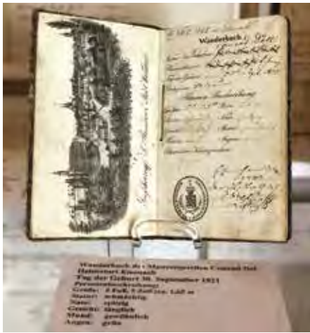
Wanderbuch des Maurergesellen Conrad Eine Ziegelsteinkraxe Dei aus Eisenach