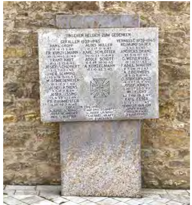
Das Kriegerdenkmal an der Kirche St. Afra in Maidbronn, welches 1957 vom Verein für Heimatpflege zum Gedenken an die Opfer der beiden Weltkriege errichtet wurde.