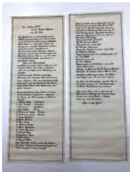
Schriftstück über die Gründung des Vereins für Heimatpflege in Maidbronn und die Entstehung des Kriegerdenkmals