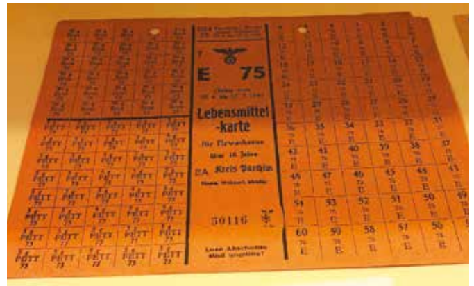
Lebensmittelkarte aus dem Jahr 1945

Ebenfalls im Museum zu bestaunen sind sog. Lebensmittelkarten aus den Jahren 1943 – 1950. Sie waren ein von den Behörden ausgegebenes Dokument, das im zweiten Weltkrieg an die Bürger gegeben wurde, um so knappe Lebensmittel, wie Brot, Fett, Zucker, u.ä. besser verwalten zu können. Offiziell waren sie die einzige Möglichkeit um bestimmte Mengen an Gütern zu kaufen. Neben Lebensmitteln rationierte man oft auch andere Güter, wie Zigaretten, Alkohol, Benzin oder auch Kleidung und Kohle durch sog. Bezugsscheine, die je nach Art eine andere Farbe hatten.