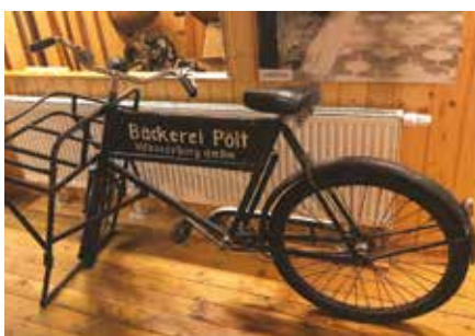
Bäckerfahrrad der Bäckerei Pölt aus Wasserburg am Inn