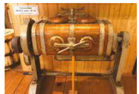
Eismaschine aus den 20er Jahren