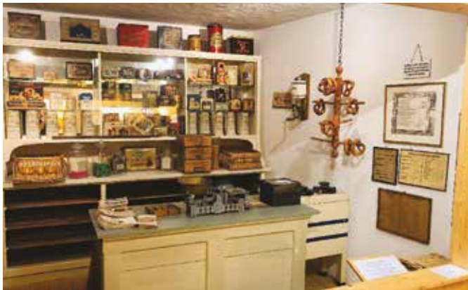
Ein Schmuckstück, der nachgestellte Bäckerladen im Bäckereimuseum

Ein tolles Ausstellungsstück im Bäckereimuseum ist auch das Bäckerfahrrad der Bäckerei Pölt aus Wasserburg am Inn, um 1920, mit späteren Umrüstungen um 1950. Schon seit Ende des 19. Jahrhunderts gibt es diese sog. Lastenräder, mit denen weltweit Botendienste verrichtet wurden. Das Bäckerfahrrad zeichnet aus, dass es mit speziellen Brotkörben ausgestattet ist. Oft sieht man Ausführungen, die ein besonders kleines vorderes Rad besitzen, da hier der große Brotkorb gut transportiert werden konnte. Mit den Rädern lieferten die Bäcker die frischen Brötchen, Brote, Kuchen und viele weitere Leckereien an ihre Kunden aus. Interessant auch, dass die Bäcker mit diesen Lastenrädern oft an sog. Lastenrad-Rennen teilgenommen haben.