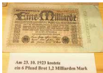
Am 23.10.1923 betrug die Kosten für ein 6 Pfund Brot 1,2 Milliarden Mark