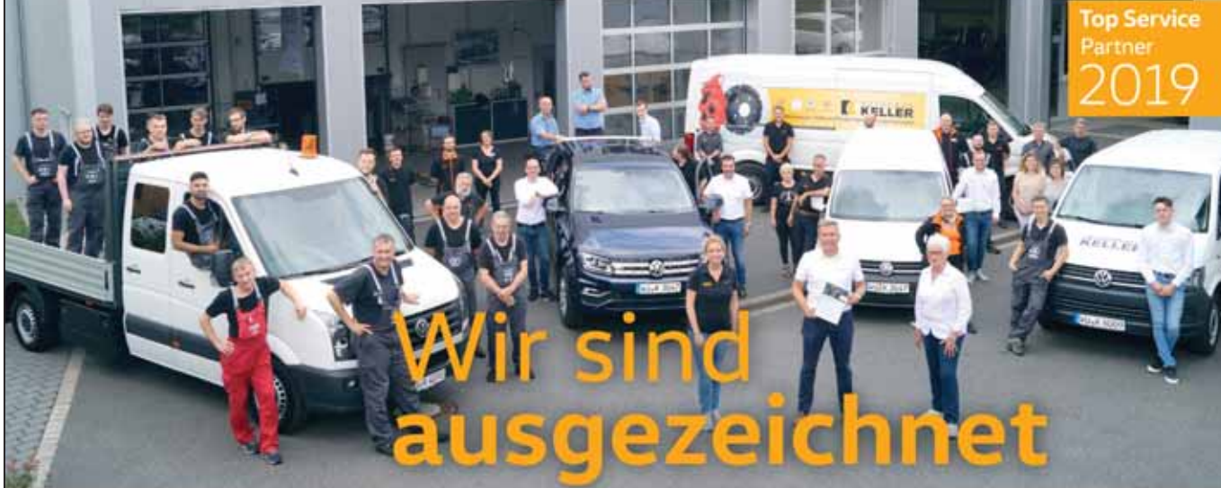
Die Mitarbeiter des Keller-Team vor dem Karosserie- und Reifenzentrum in Veitshöchheim.