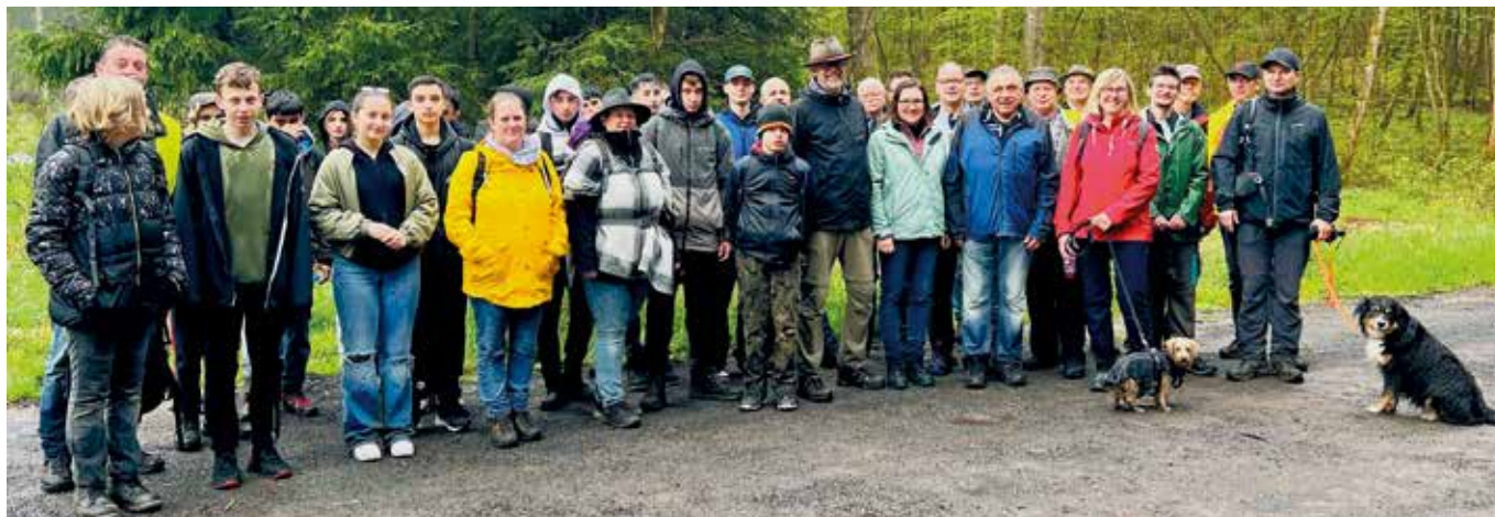
Die Teilnehmer des diesjährigen Rimparer Grenzgangs.