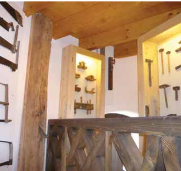
Maurer- und Zimmerei-Museum