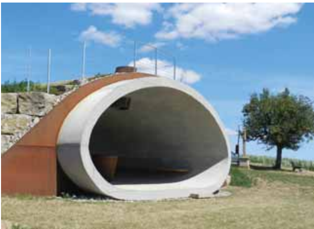
Kobel – im Weinbaugebiet Kobergsberg