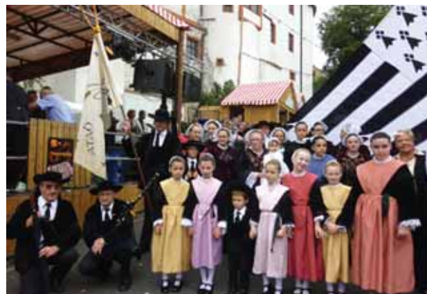
Regelmäßig wird das Rimparer Schlossfest durch traditionelle Tanzgruppen aus Languidic in historischen Kostümen bereichert