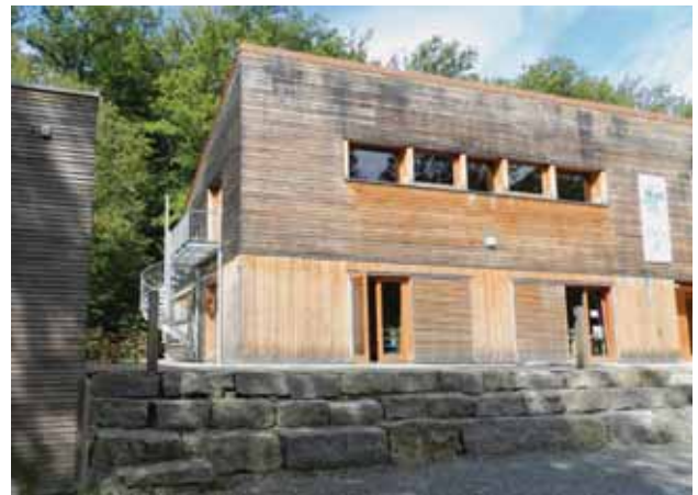
Waldlerlebniszentrum im Einsiedel