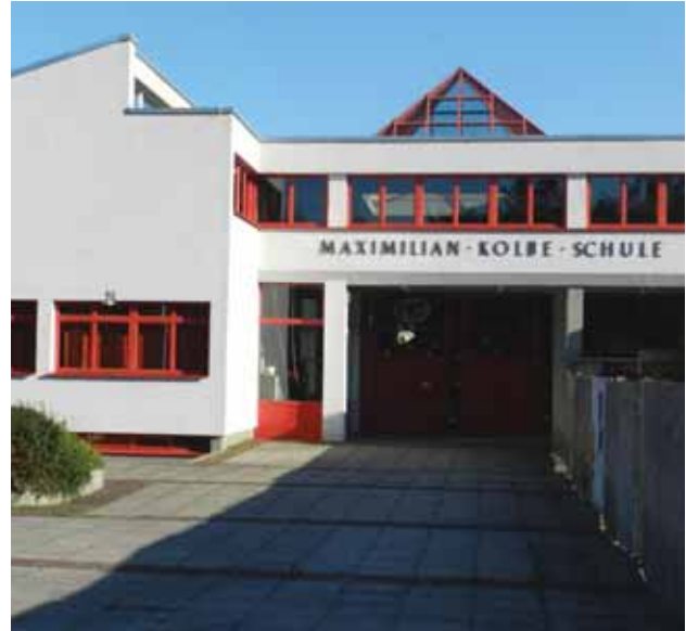
Maximilian-Kolbe-Hauptschule in Rimpar