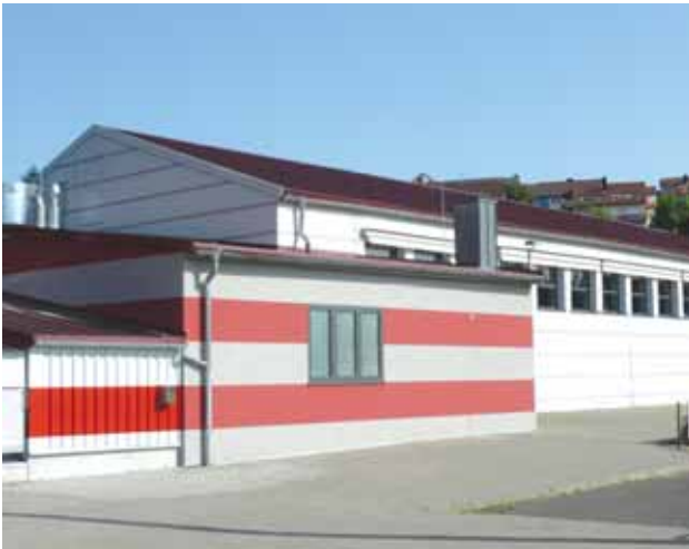
Außenansicht Turnhalle Neue Siedlung in Rimpar

1. Kommandant Theo Eschenbacher Danziger Straße 4, 97222 Rimpar, Telefon 093 65/39 80, Fax 093 65/39 80, www.ff-rimpar.de