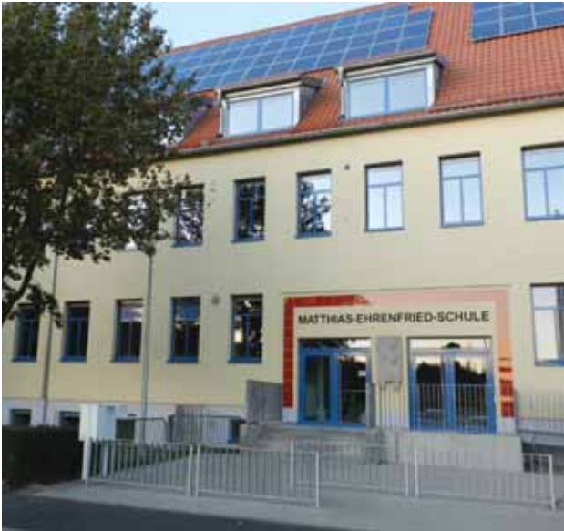
Matthias-Ehrenfried-Grundschule in Rimpar