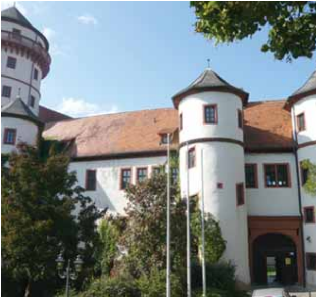
Eingang zum Rathaus