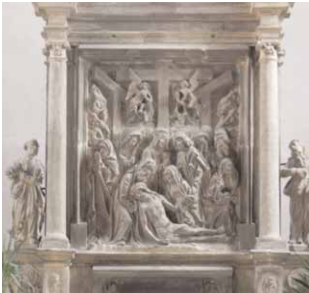
Riemenschneider-Altar in der Pfarrkirche Maidbronn