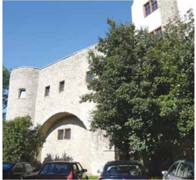
Westruine – Ansicht Bachgasse