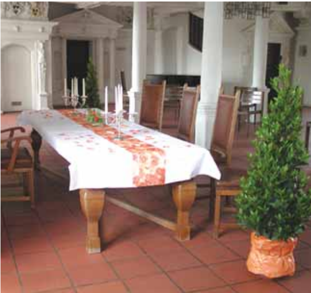
Trauung im Rittersaal