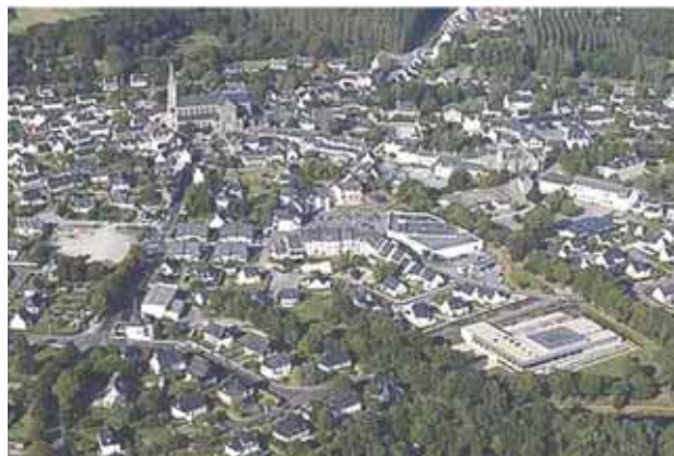
Languidic aus der Luft, im Vordergrund rechts die Mediathèque