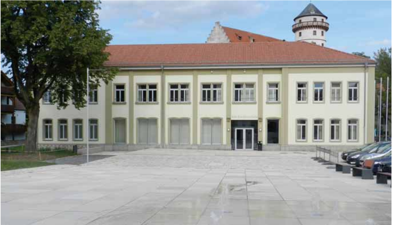
Neue Ortsmitte mit sanierter Knabenschule