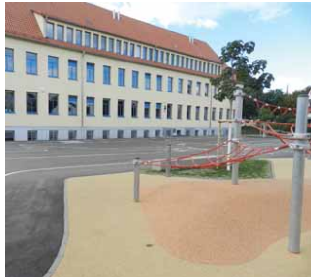
Neu gestalteter Pausenhof in der Matthias-Ehrenfried-Grundschule