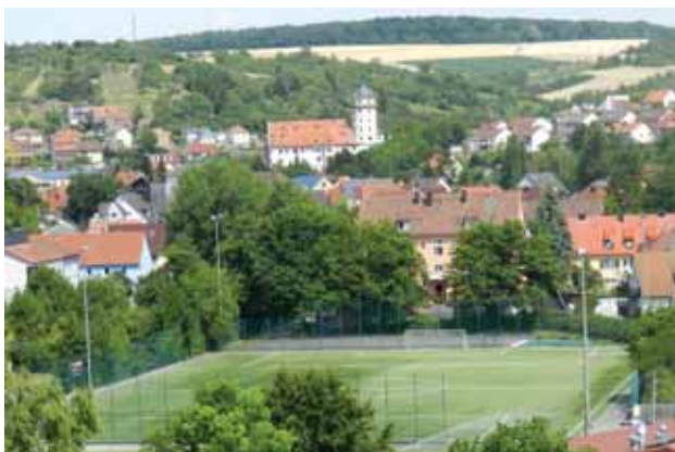
Kunstrasenplatz am Sportgelände in Rimpar

Retzstadter Straße, 97222 Rimpar OT Gramschatz