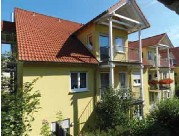
Caritas Sozialstation St. Gregor in Rimpar mit Sozialstation und Tagespflege (betreutes Wohnen und stationäre Pflegeeinrichtung des Kommunalunternehmens).