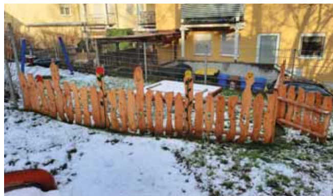
Abgrenzungszaun Kindergarten Rappelkiste.