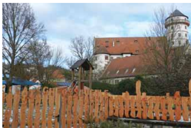
Neuer Zaun Schlossmühlkindergarten.