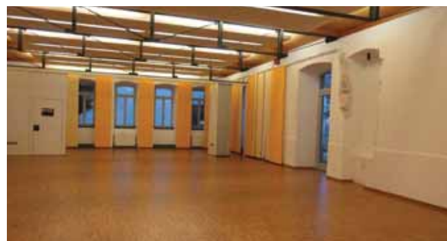
Fußboden- und Wandsanierung „Alte Knabenschule“.