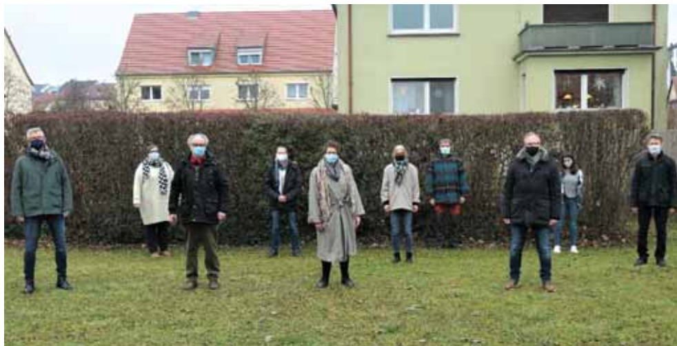
Die Gründungsmitglieder des Vereins Weltladen Rimpar e.V.

Ein ganz wichtiger und großer Schritt hin zum Weltladen in Rimpar