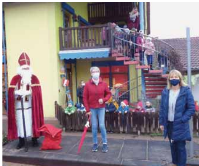
Verschiedene Aktivitäten im Kindergarten Rappelkiste.