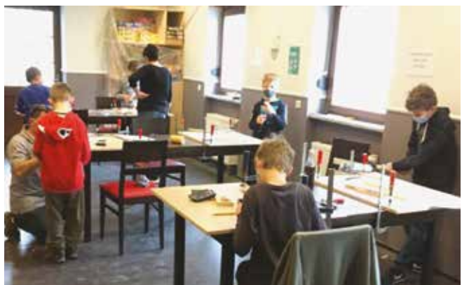
Vorweihnachtliche Bastelei des KiJuRim im Jugendzentrum