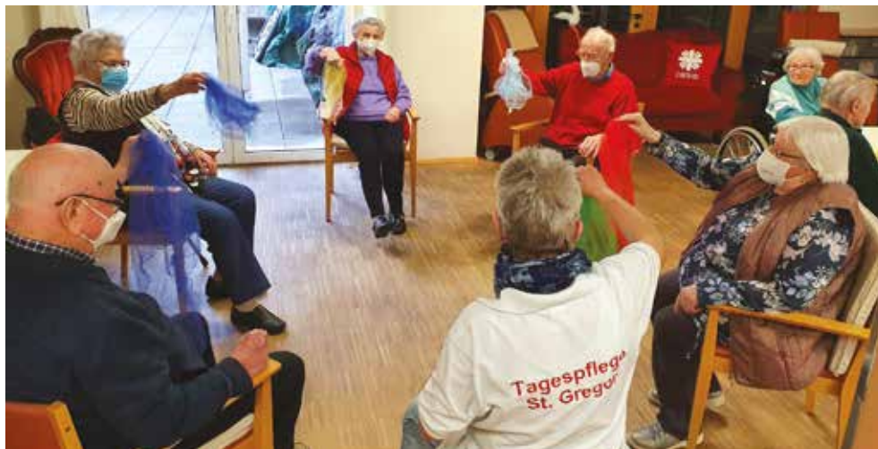
Die Gäste der Tagespflege genießen die sozialen Kontakte und die verschiedenen Aktivitäten. Auch die gemeinsamen Mahlzeiten schätzen die Senioren sehr.