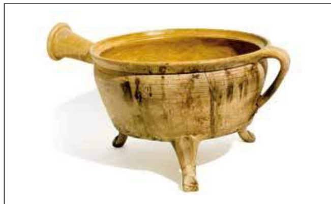
Ein aus im Schloss gefundenen Scherben zusammengesetztes Dreifußgefäß mit einem sog. Tüllengriff.