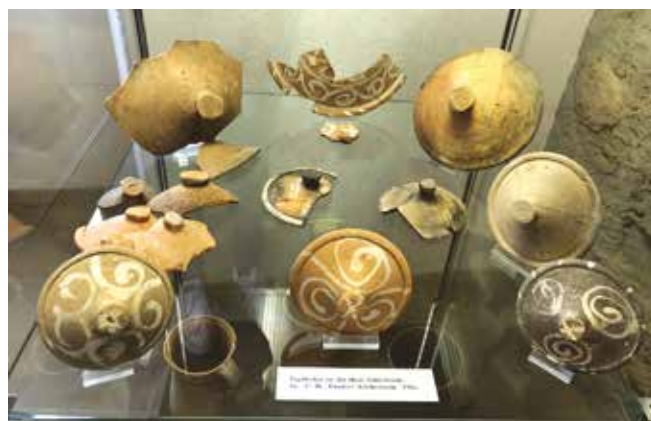
Schön verzierte Topfdeckel aus der ehemaligen Schlossküche; 16.–17. Jahrhundert, gefunden im Küchenturm.