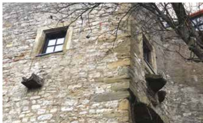
Der Ausguss aus dem Fenster der ehemaligen Küche im Westturm ist noch heute an der Außenfassade zu sehen.