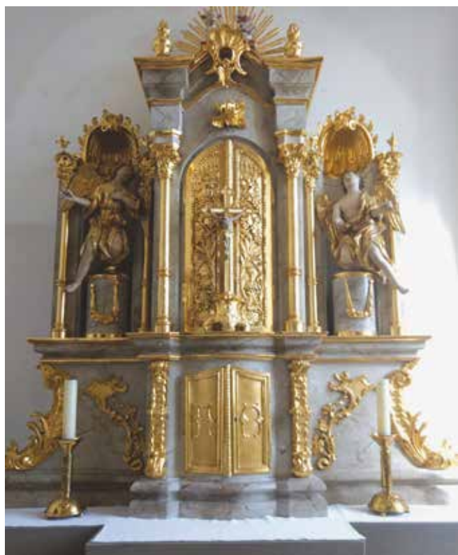
Renovierter Altar in Burghausen