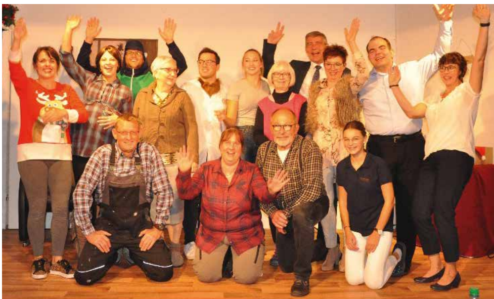
Über ein baldiges Wiedersehen freuen sich die Akteure der Laienspielgruppe Rimpar.

Text + Foto: Frank Hochstetter, 1. Vorstand