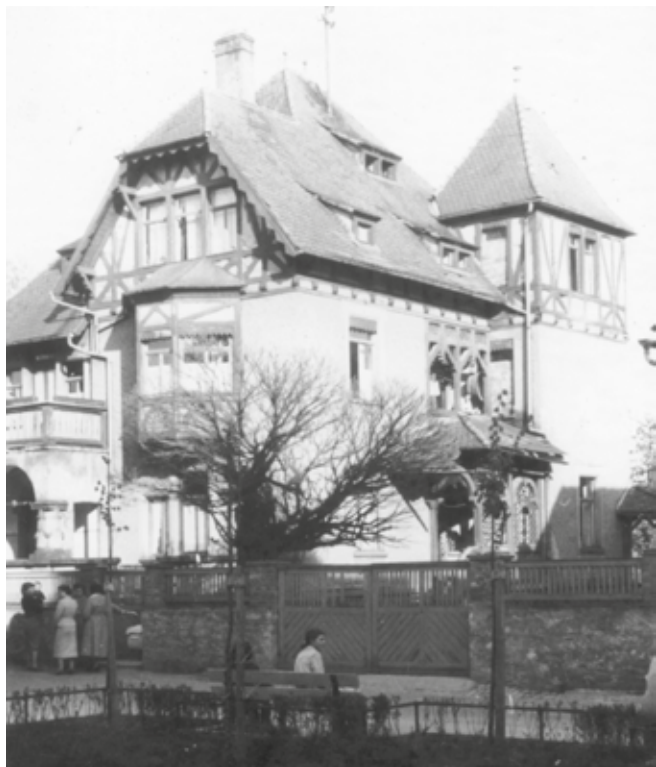
Alte Ansicht Borges Villa