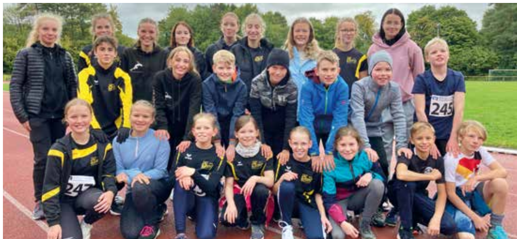
Trotz dunkler Wolken: Freude über den Bezirkssieg in Hösbach