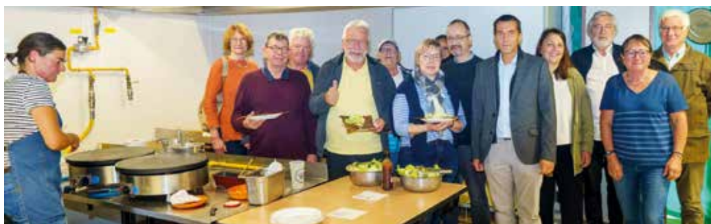
Es gibt Galettes!