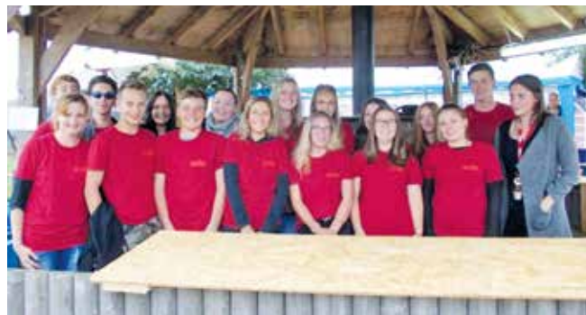
Betreuer*innen 2017

Haben wir Ihr/Dein Interesse geweckt? Dann bei der Gemeindejugendarbeit – Lutz Dieter – melden, vorbeikommen, gegenseitig kennenlernen und Fragen stellen. Dort erfährst Du auch, was wir alles vor der Zulassung als Betreuer von dir noch brauchen. Keine Sorge: Alles machbar! Am 16. Juni ab 15.00 Uhr wird die Anmeldung für das Hüttendorf in der JugendApp freigeschaltet! Es gibt wie die letzten Jahre auch eine Höchstteilnehmerzahl je Woche, welche sich nach der Anzahl der mitarbeitenden Betreuer richtet. Da heute noch nicht vorhersehbar ist wie viele Betreuer sich bei mir melden, kann ich noch keine genaue Teilnehmerzahl benennen. Die allerhöchste Teilnehmerzahl je Woche wird allerdings bei 200 Kindern liegen. Liebe Eltern: Den 16. Juni schon mal ganz dick im Kalender eintragen und die Anmeldung zum Hüttendorf nicht vergessen!